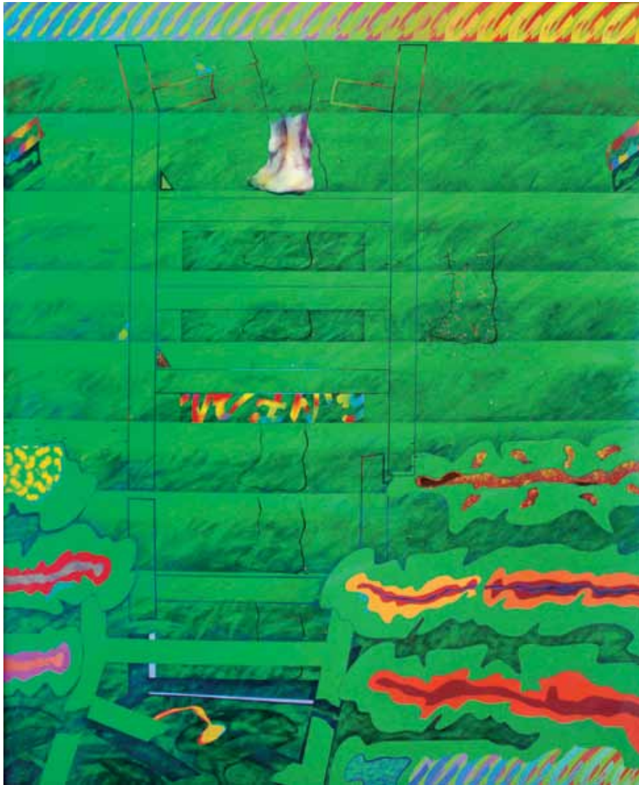
Descodificació. Petxades i testimonis formàtics. Pintura a l'oli sobre tela. 162 x130 cm. 1977-78. Cadaqués.