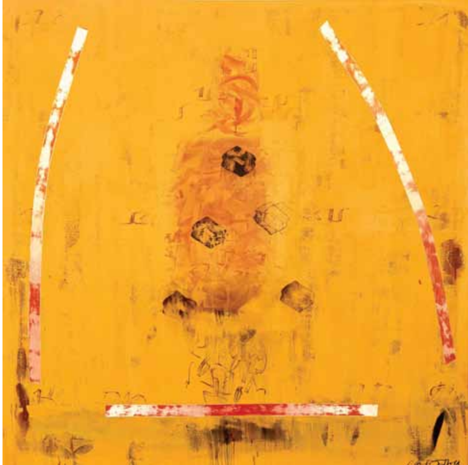
Triangle de protecció. Acrílic-làtex i pigments sobre tela. 164 x 164 cm. 2011. Cadaqués.