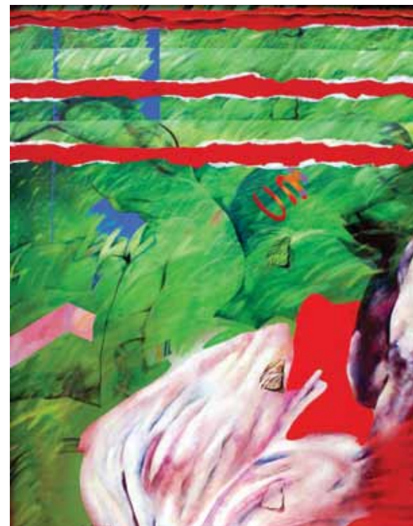
Persecució. Entorn ecològic. Pintura a l'oli sobre tela. 146 x 116 cm. 1976-77. Cadaqués

Així doncs, a l'eixopluc d'aquest paraigües estètic i conceptual, i sense cap dogme sinó anar fent a complaença i d'acord amb la seva veritat interior, s'ha construït els cosmos creatiu d'un home humil. Un home, diria Josep Pla, sense pretensions de vanaglòria, que disfruta en la intimitat, entre els amics i sense fer fressa, però sí fent una remor incesant!