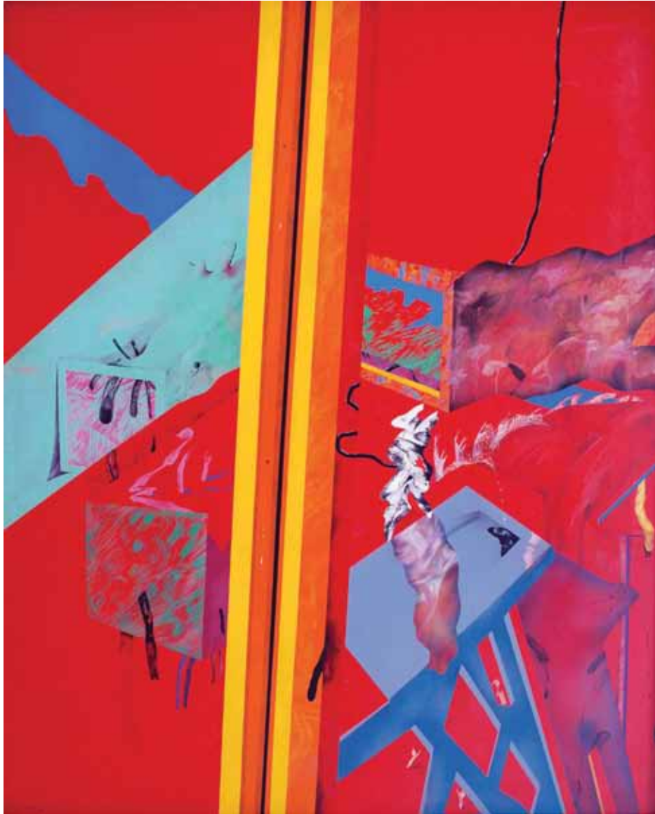
Element-Bigueta 2. Formes de comunicació. Pintura a l'oli sobre tela. 162 x 130 cm. 1972-73. Cadaqués.