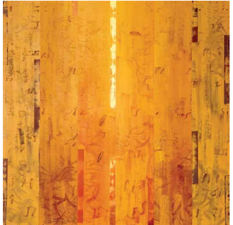
Fases de llum 2. Acrílic-làtex i pigments sobre tela. 164 x 164 cm. 2011. Cadaqués.