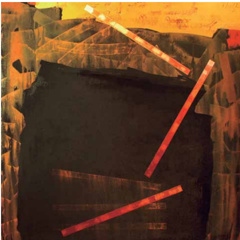
Espai ocre-2. Posicions. Arc de tanques. Acrílic-làtex i pigments /tela. 185 x 192 cm. 2012. Cadaqués.