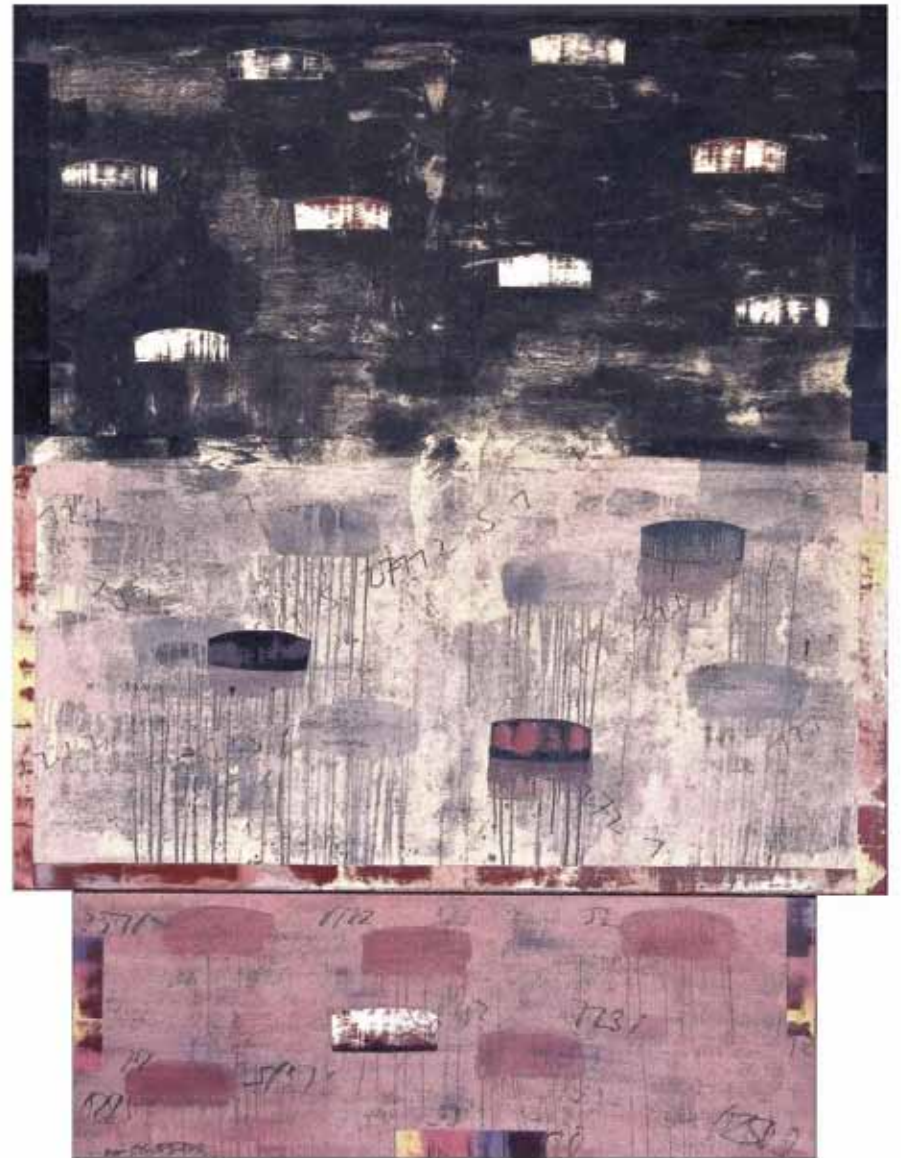
Posicions d'aigua 12. Pintura a l'oli sobre tela. 260 x 200 cm. 2009/2010. Cadaqués.