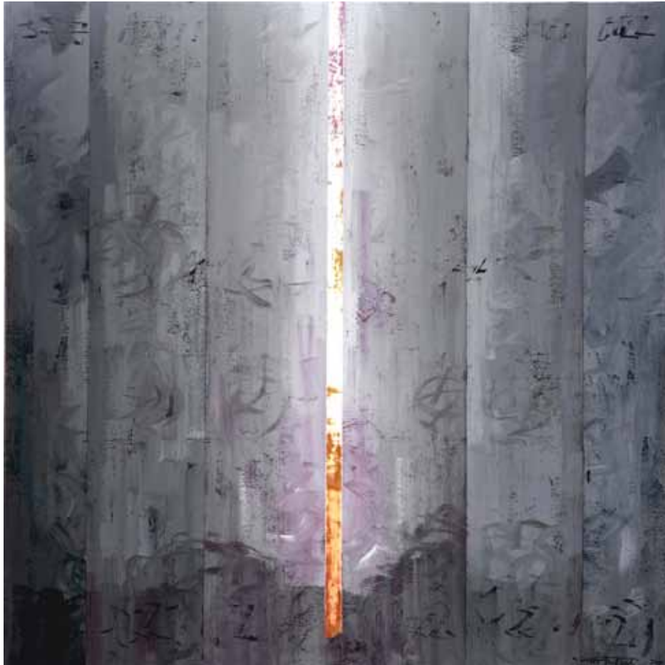
Fases de llum 1. Acrílic-làtex i pigments sobre tela. 164 x 164 cm. 2010. Cadaqués.