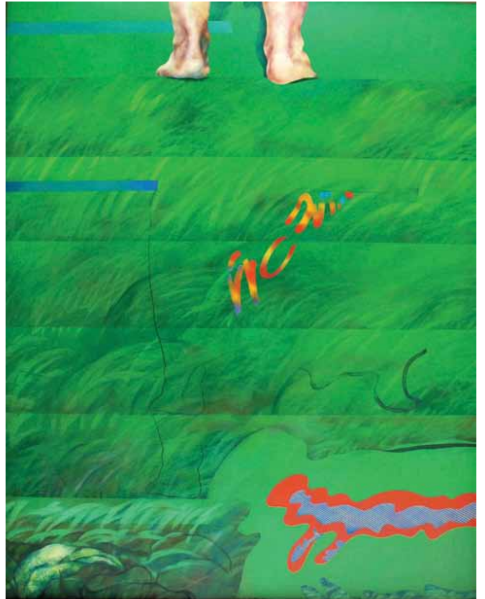
Petxades i circumstàncies. Descodificació 2. Pintura a l'oli sobre tela. 146 x 116 cm. 1976-77. Cadaqués.