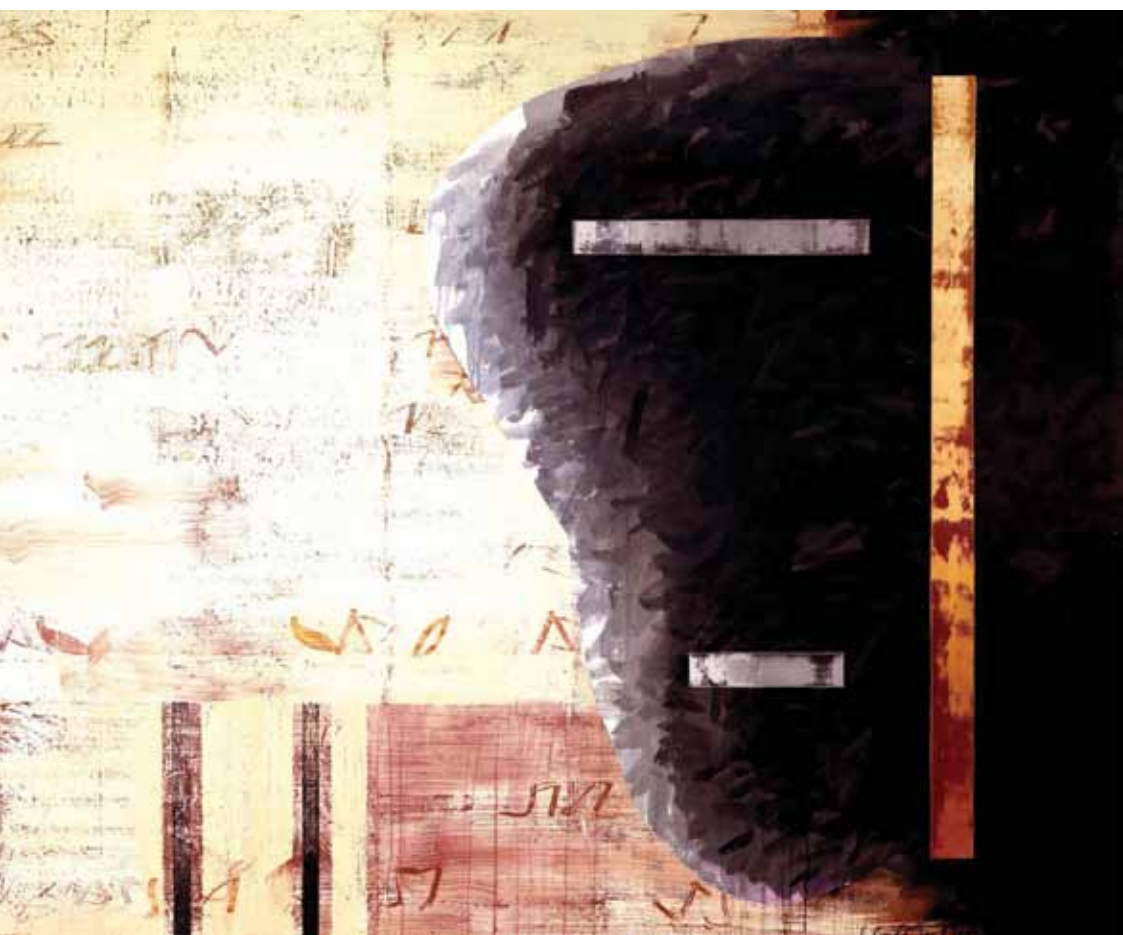
Forma de gest i de temps. Acrílic-làtex i pigments sobre tela. 170 x 210 cm. 2011. Cadaqués.