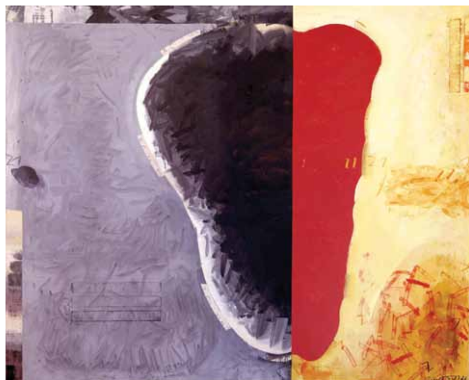
Estudi per a la forma C-21. Adherències i restes. Acrílic-làtex/tela. 170 x 210 cm. 2011. Cadaqués.