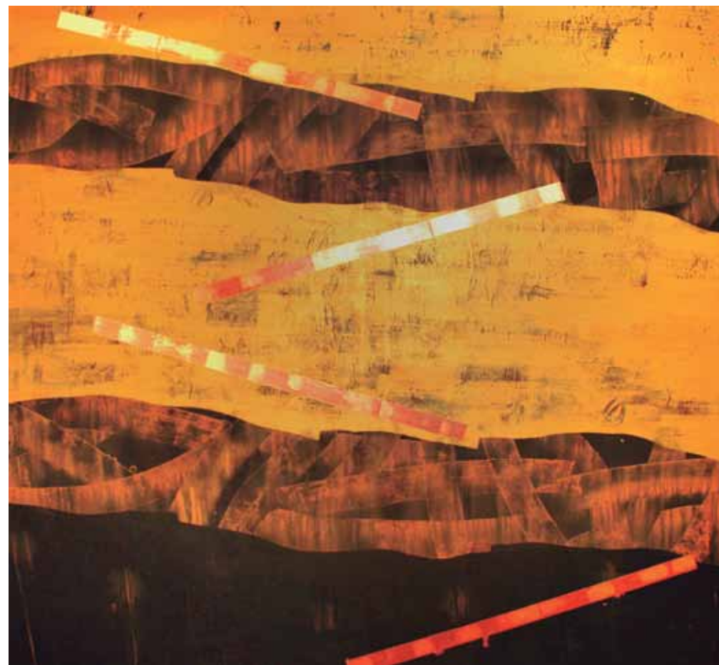
Espai ocre-3. Posicions. Doble tanca. Acrílic-làtex i pigments sobre tela. 185 x 192 cm. 2012. Cadaqués.