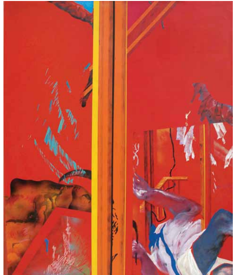
Element-Bigueta 1. Entorn. Pintura a l'oli sobre tela. 162 x 130 cm. 1972-73. Cadaqués.